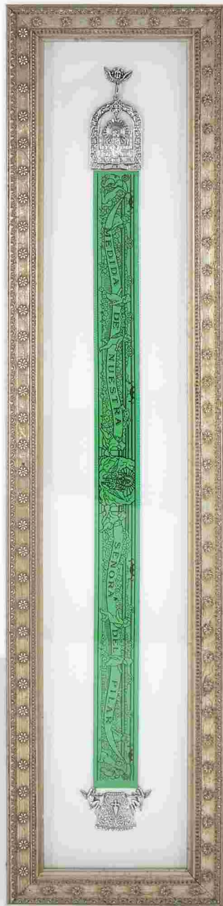
· Nº 1